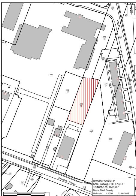
Anlage zu VO/0419/23/VA

Der Verwaltungsausschuss beschließt den Erwerb einer Teilfläche des Flur- stückes 262/15 der Gemarkung Kötitz von der AUMA Drives GmbH.