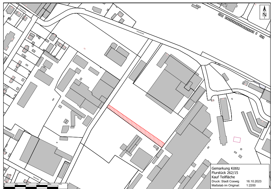
Anlage zu VO/0421/23/VA